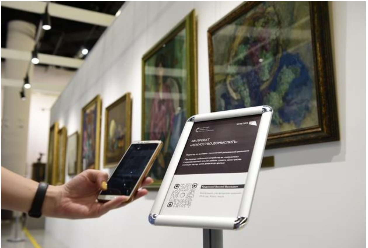
QR-код проекта «Искусство ДО-мыслить»

Также на цифровой платформе «Artefact» в конце декабря текущего года осуществили запуск выставочных проектов и экспозиций в формате дополненной реальности музеи, вошедшие в перечень победителей по результатам конкурсного отбора Министерства культуры Российской Федерации по созданию мультимедиа-гидов: музей «Дворец Наместника» с проектом «Музей истории управления Сибирью», «Тобольский губернский музей» с проектом «Первый сибирский музей», «Дом М.И. Муравьева-Апостола» – «Историко – мемориальный музей» с экспозицией «Декабристы в Ялуторовске» и «Казанский районный краеведческий музей им. В.С. Аржиловского» с экспозицией «Флора и фауна Казанского района».