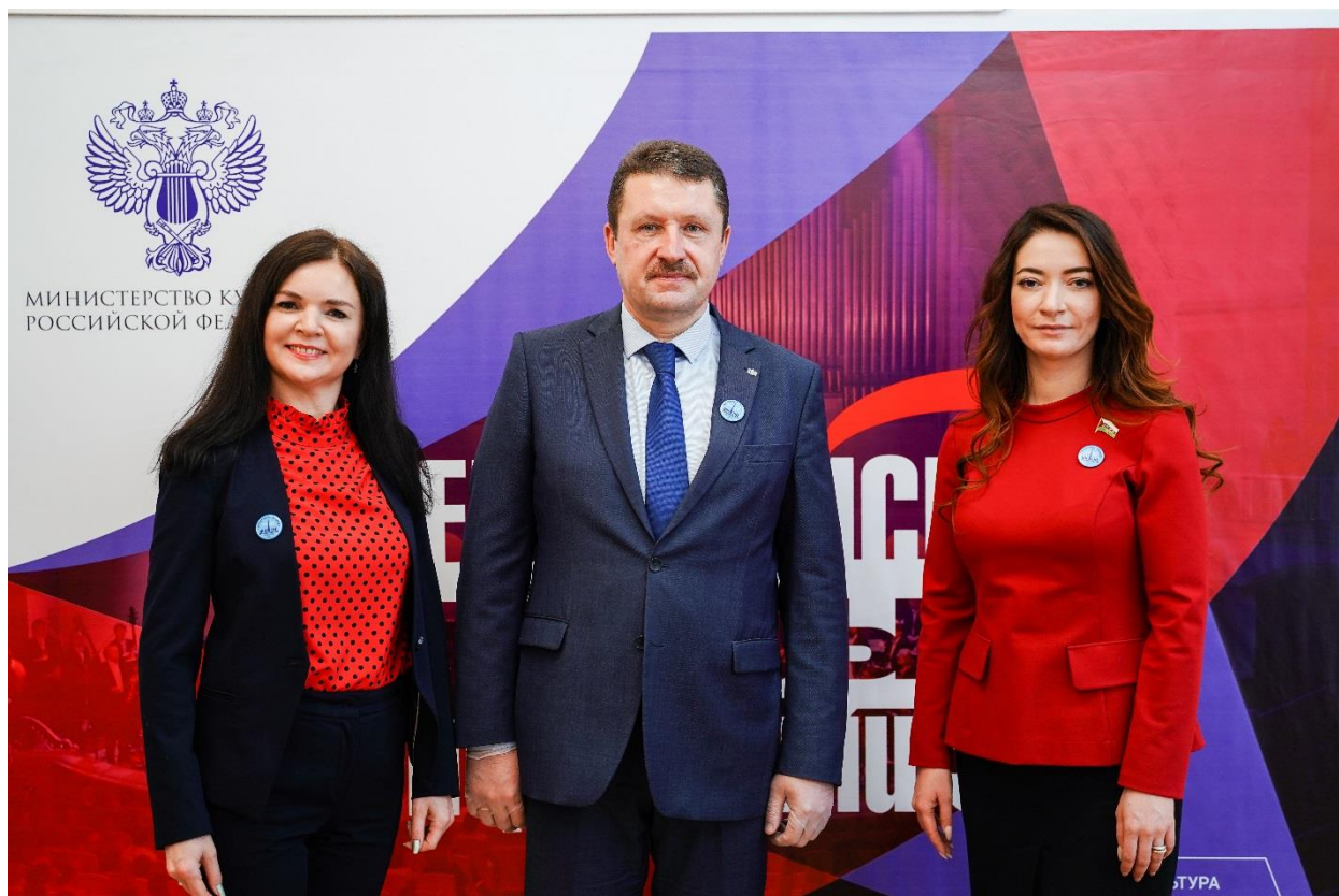
Открытие виртуального концертного зала в городе Ялуторовске

Кроме того, МАУК г. Ялуторовска «Арт-Вояж» признано победителем конкурсного отбора Министерства культуры Российской Федерации на создание виртуальных концертных залов (год реализации - 2022).