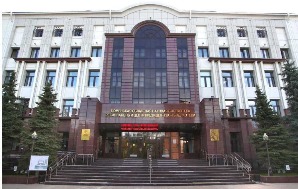
Фото 5: Тюменская областная научная библиотека им. Д.И. Менделеева

IV. В 2019 году в Тюменской областной научной библиотеке им. Д.И. Менделеева начал работу центр по работе с «книжными памятниками», в котором осуществляется деятельность по оцифровке изданий, а с 2020 года начнется их передача в Национальную электронную библиотеку. Дополнительно сотрудниками центра осуществляется работа с библиотеками различных учреждений, коллекционерами и заинтересованными жителями Тюменской области по выявлению у них подобных изданий для их дальнейшей оцифровки и передачи в Национальную электронную библиотеку. (Фото 5)