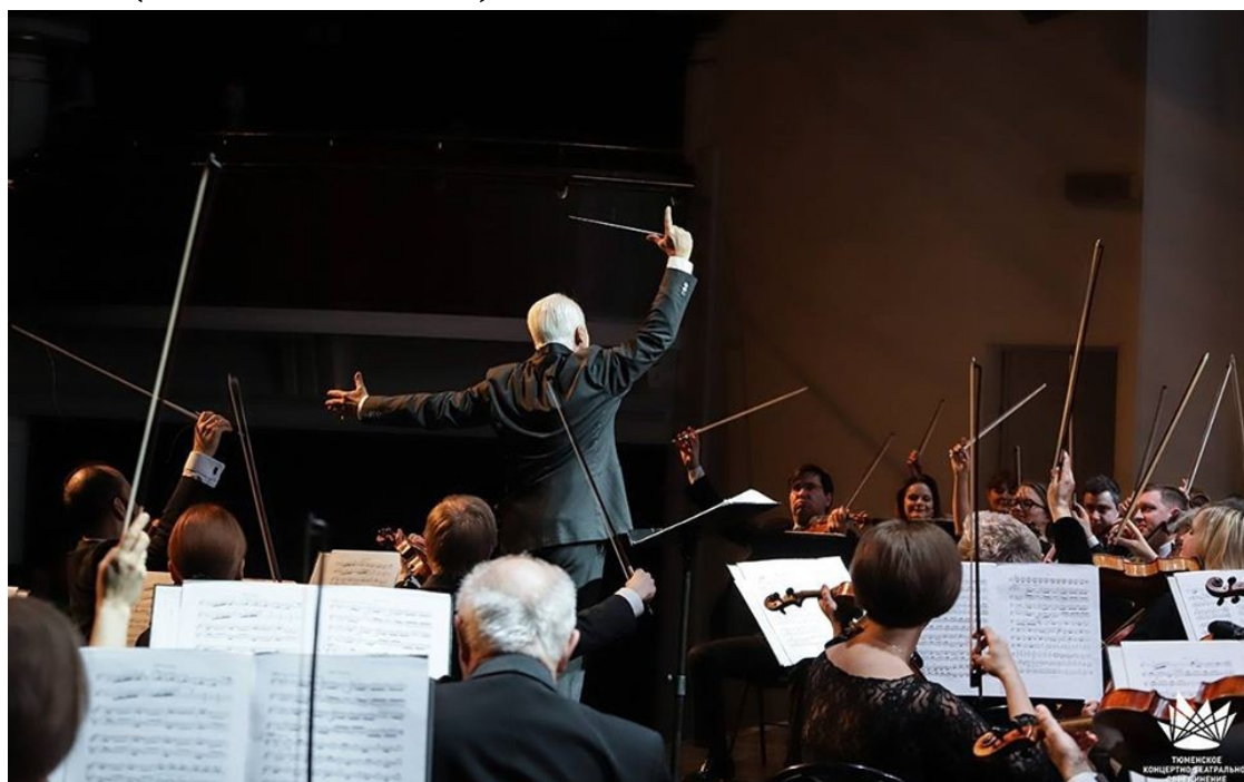
Фото 1: Онлайн - трансляция музыкального фестиваля «Владимир Сиваков приглашает» в Доме культуры «Синтез», г. Тобольск

I. Состоялось открытие трех виртуальных концертных залов на базе Дома культуры «Синтез» г. Тобольска, Центра культуры и искусства «Современник» г. Тюмени, а также в Доме культуры г. Ишима. (Фото 1, Фото 2)