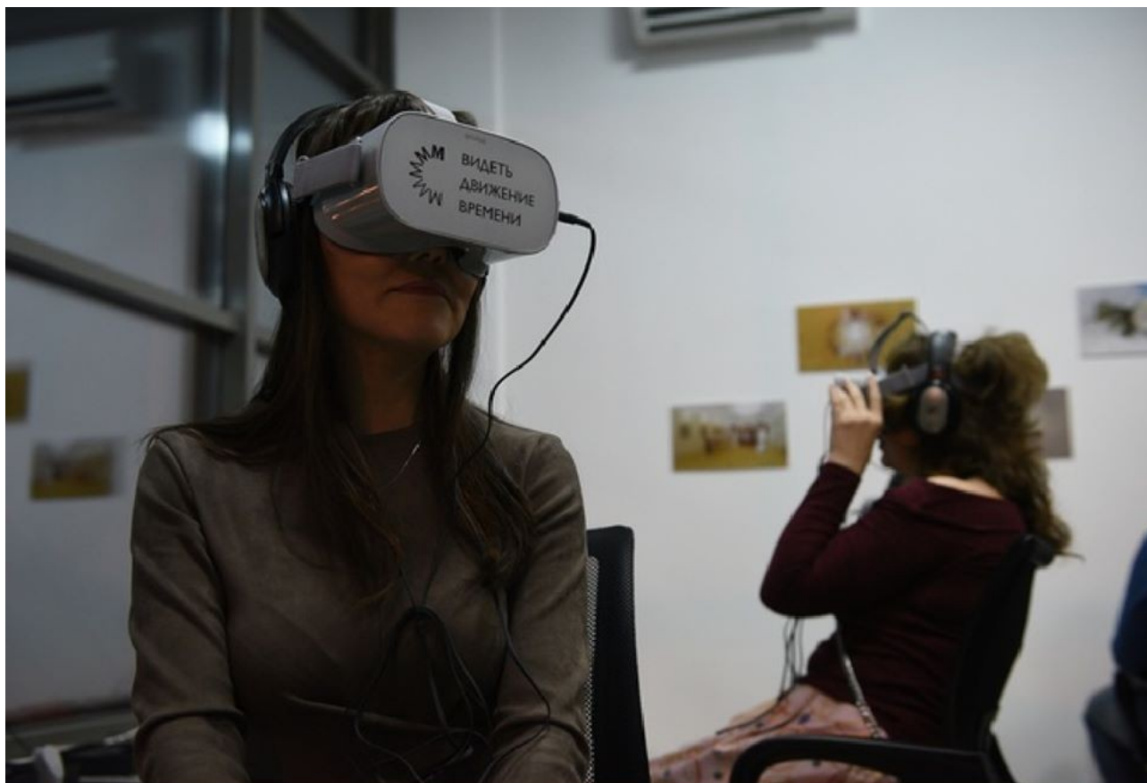
Фото 3: Презентация первого регионального VR-тура «Дальняя Государева Вотчина»

II. В рамках проведения акции «Ночь искусств» в трех городах - Тобольске, Ялуторовске и Тюмени был презентован первый региональный виртуальный тур «Дальняя Государева Вотчина». С помощью цифровых технологий посетители музеев совершили виртуальное погружение во времена освоения Сибири, начиная с XVII века и до 1917 года. В съемках контента принимали участие актеры региона. В декабре также был презентован еще один VR-тур об истории Царской семьи по выставочным проектам Музея Семьи Императора Николая II. (Фото 3)