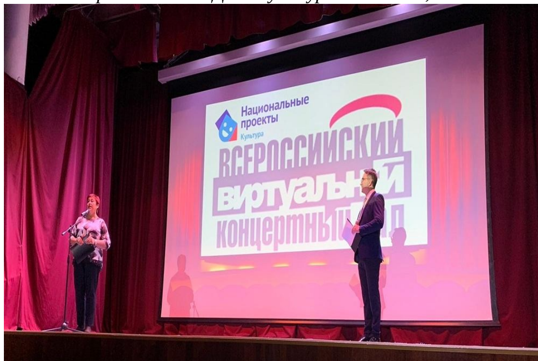
Фото 2: Торжественная церемония открытия виртуального концертного зала, г. Ишим